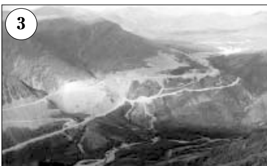
53—58-й километры трассы. Дорога проходит по двум большим насыпям и выходит на перевал (высота 1624 м)