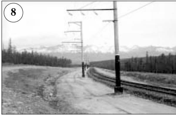
15-й километр трассы. Начинается подъем из Верхнечарской котловины через перевал Эмегачи в долину реки Нижний Ингамакит. На заднем плане — хребет Кодар