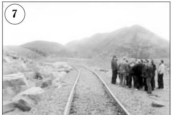
Осмотр железной дороги и выемки. Опаснейший участок (54-й км), слева лежат негабариты, которые при падении иногда наносили крупные повреждения рельсам. Здесь будет строиться галерея закрытого типа