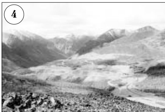
Вид на 56—58-й километры трассы. Дорога выходит из долины Нижнего Ингамакита на перевал (водораздел Олекмы и Витима) высотой 1624 м. Это самая высокая точка дороги. На заднем плане — отроги хребта Удокан, покрытые первым снегом. Справа — гора Левая Наминга, за ней — глубокий каньон, для пересечения которого потребовалось создать насыпь высотой 100 м