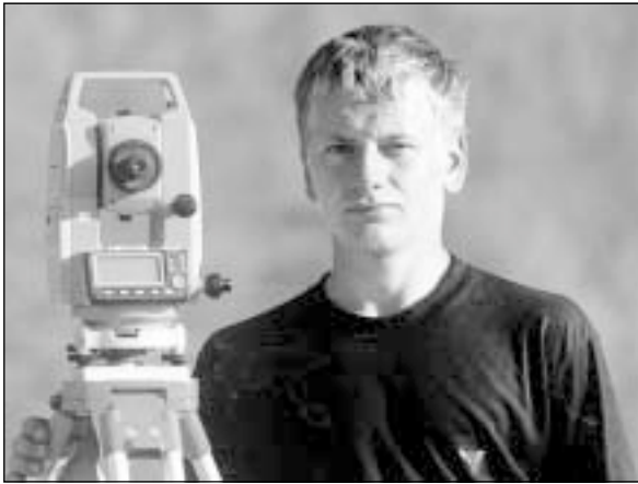
Автор с теодолитом на трассе