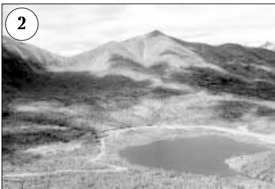
Внизу — перевальное озеро, из которого вытекает река Чина. На берегу озера — самая высокая станция в России на высоте 1610 м. На заднем плане — хребет Удокан