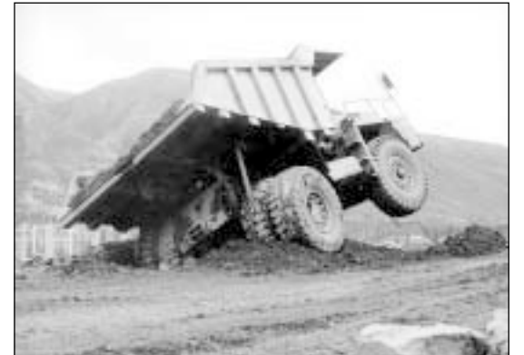
БелАЗ, провалившийся в яму, образовавшуюся при оттаивании многолетней мерзлоты