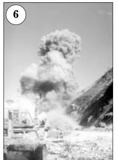
Взрыв (30 т взрывчатки) на 51-м километре. Ведется разрыхление твердого метаморфизованного песчаника