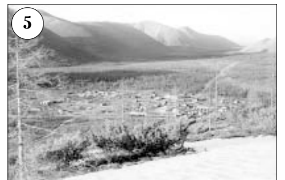
Вахтовый поселок Чина, в котором находилась механизированная колонна. Население — 300 человек. Поселок расположен в межгорной долине на высоте 1535 м. На заднем плане — хребет Удокан, станция Чина расположена слева. По долине распространена лиственница, многочисленны ягодники, на вершинах — сильно угнетенный кедровый стланник