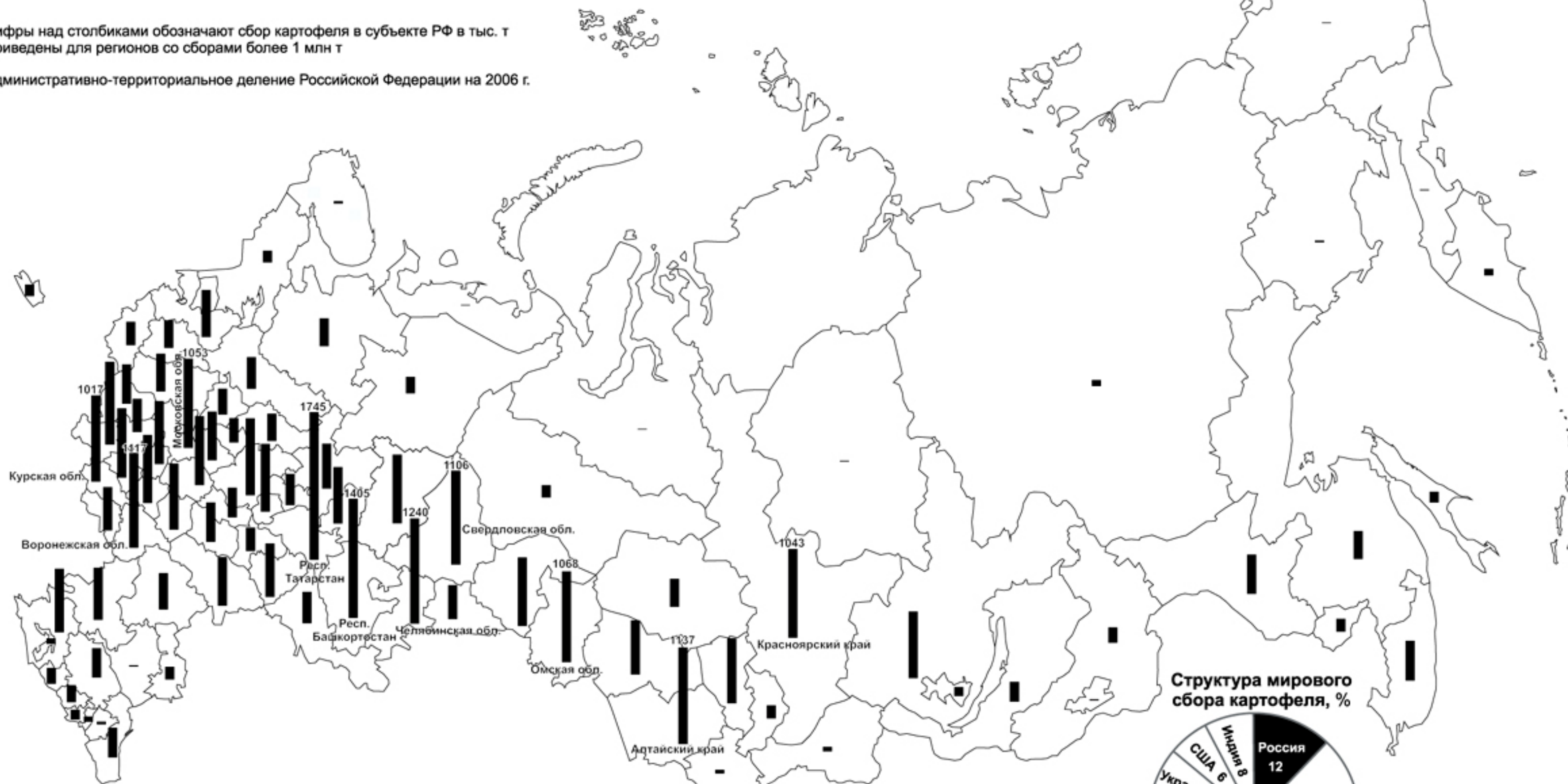
Сбор картофеля 2006, тыс. т

Административно-территориальное деление Российской Федерации на 2006 г.